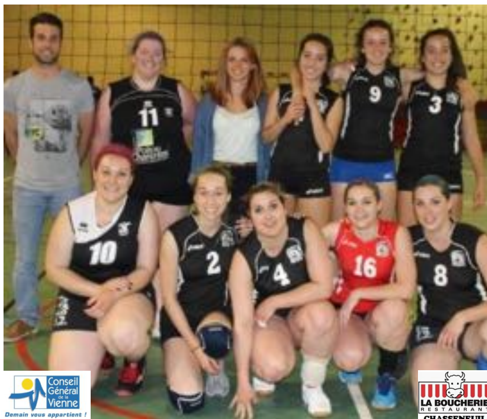
STADE POITEVIN 2