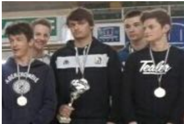
Equipe M17 M UNSS Lycée Camille Guerin