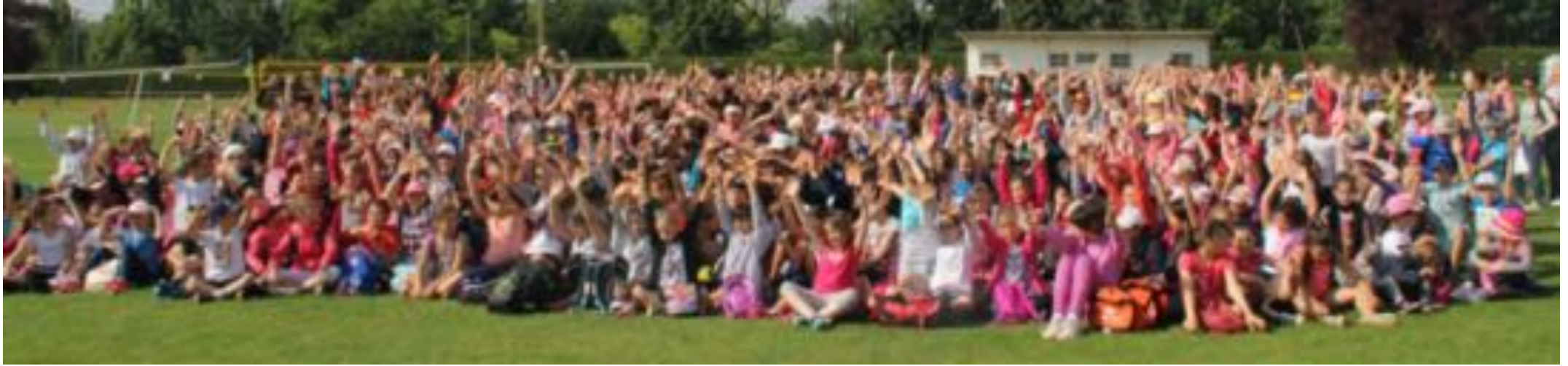
Teen Beach M11