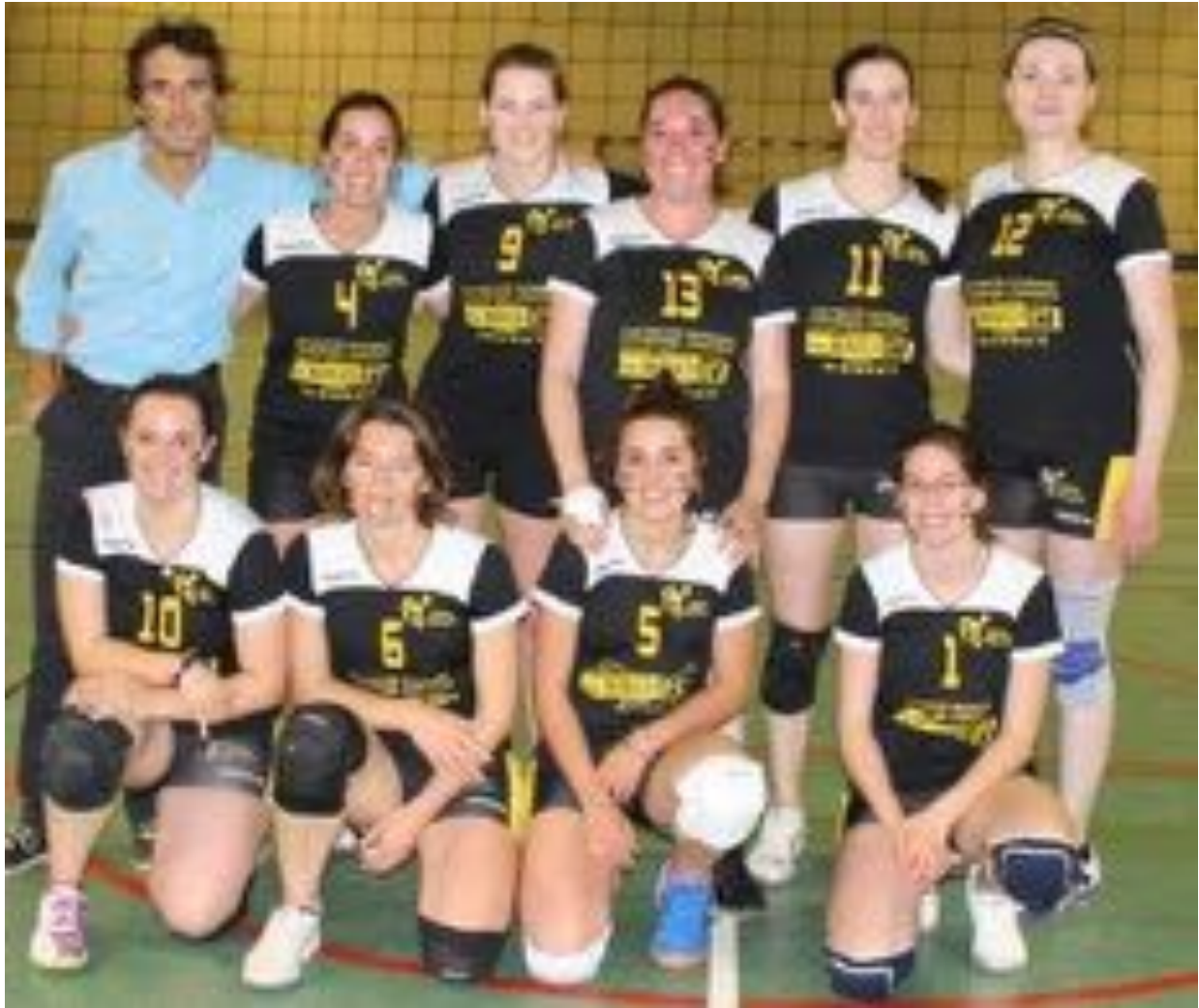
MIGNE AUXANCES 1