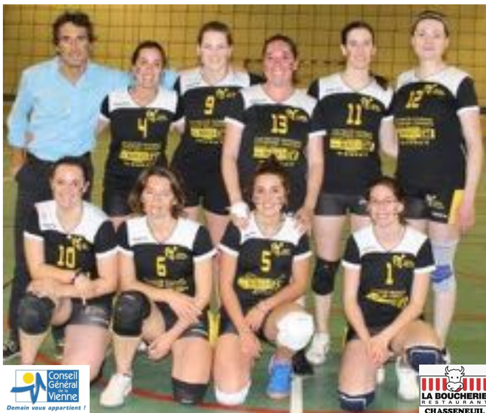
MIGNE AUXANCES 1