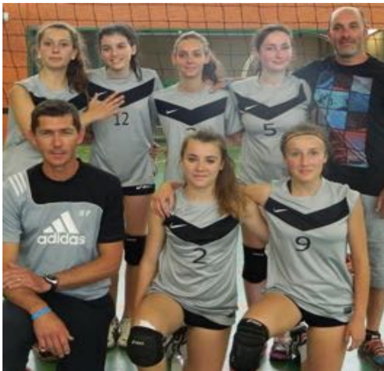
Equipe M15 F UNSS Collège Neuville (Jean Rostand)