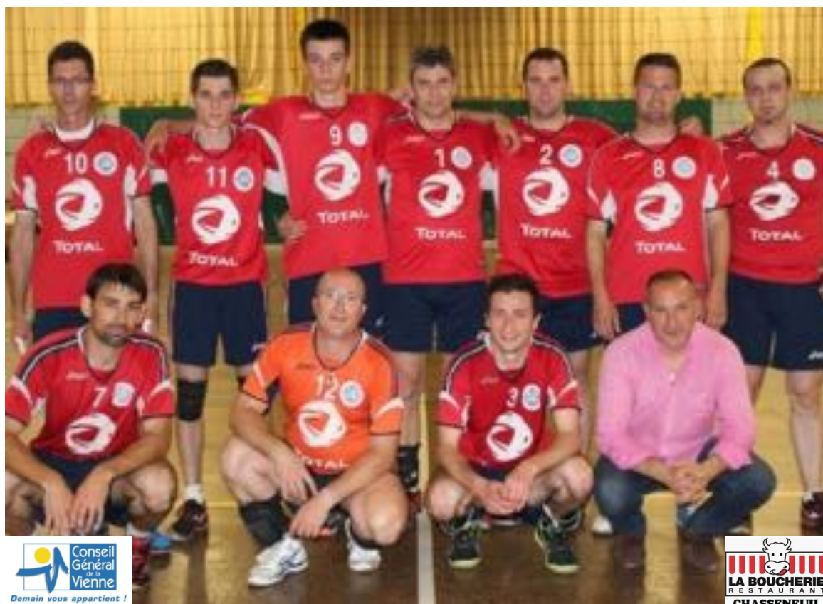
SEVRES ANXAUMONT 1