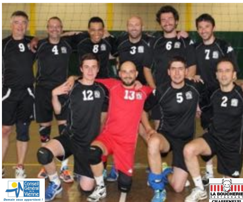
STADE POITEVIN 5