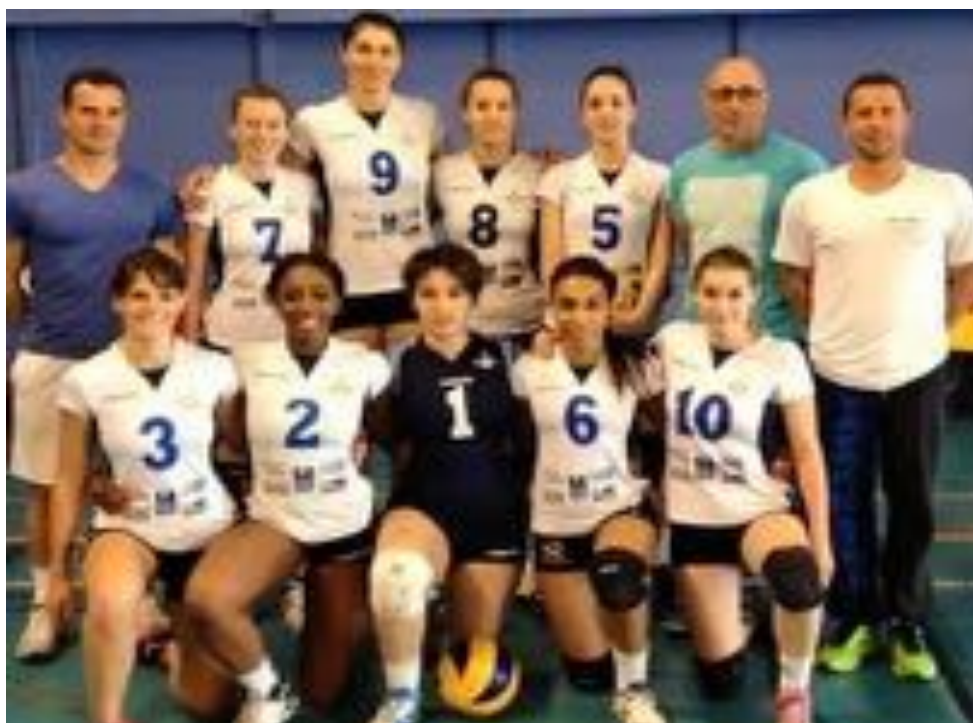
Equipe Universitaire Féminine de Poitiers