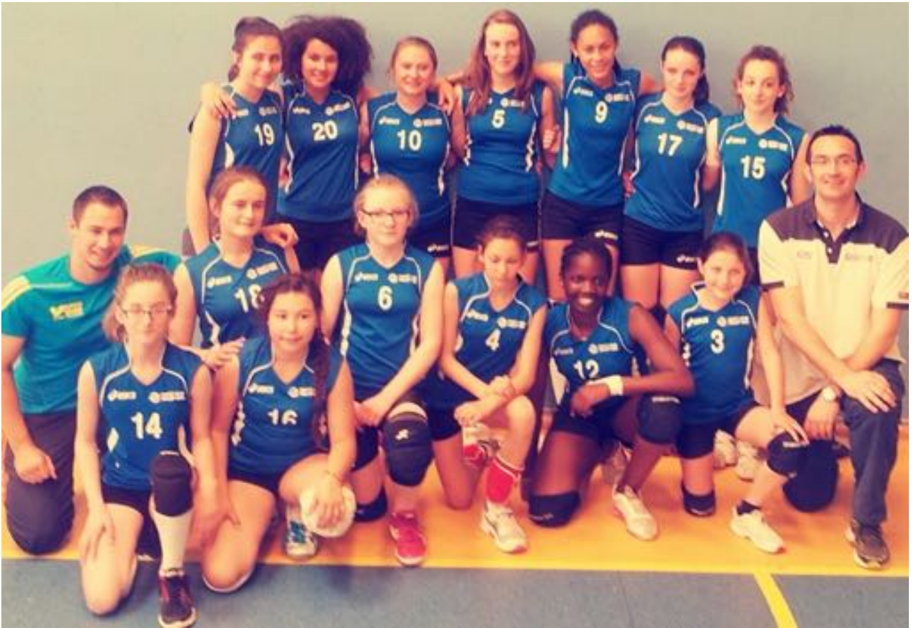
Sélection M13 M