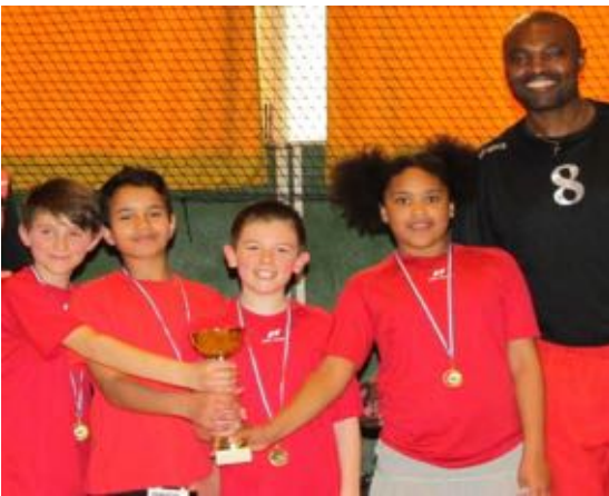
Chatellerault M11 Champions Régionaux