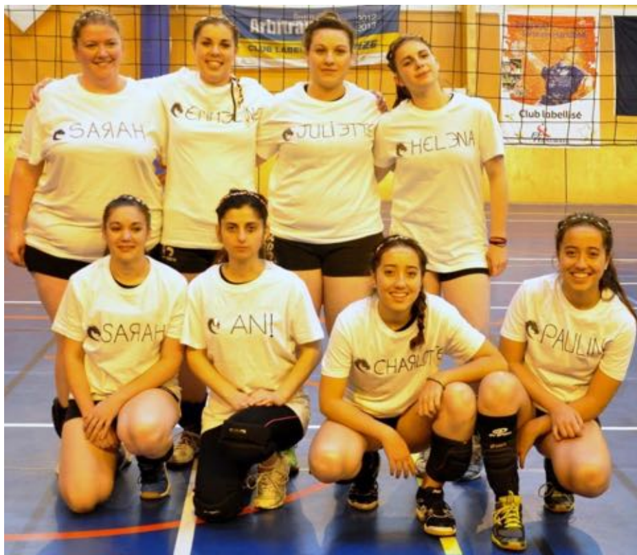
STADE POITEVIN 2