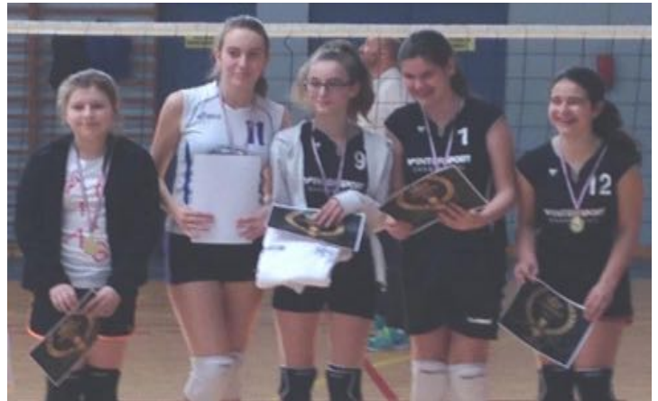
Cissé M13 F Championnes Régionales