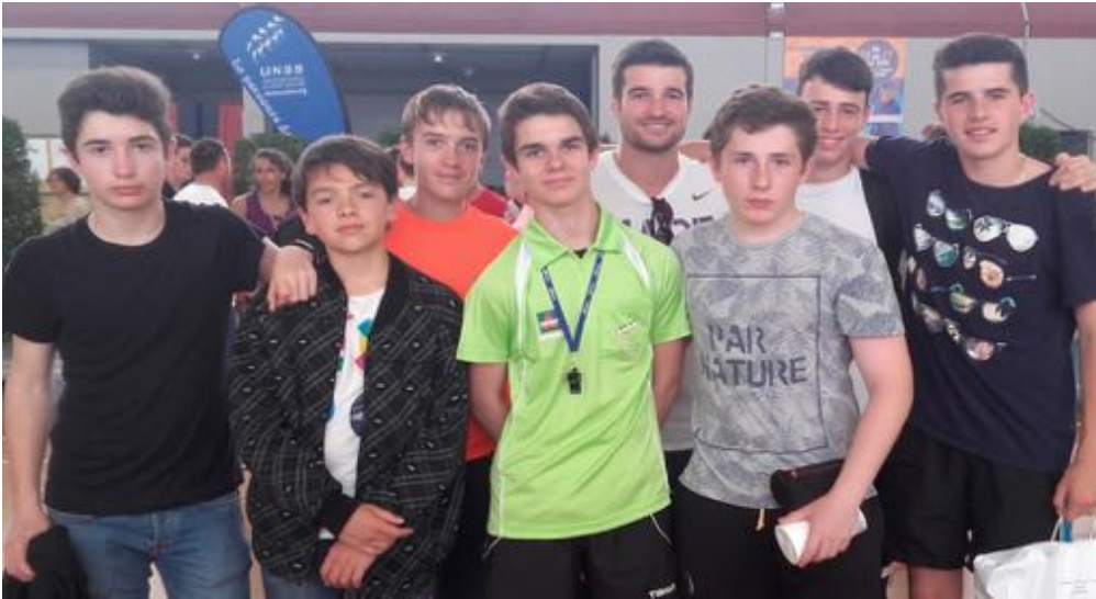
LA CHAUME (10ème France UNSS)