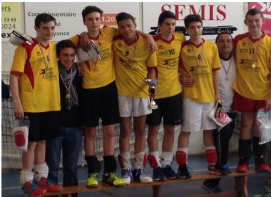
Sèvres Anxaumont M15 M Champions Régionaux