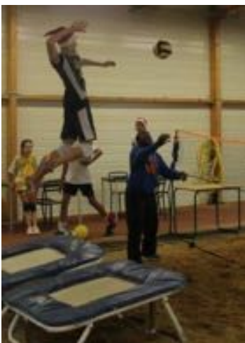
LE VOLLEY TRAMPO