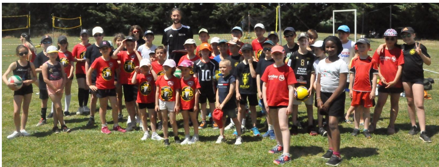
Étape de Sèvres-Anxaumont : 72 participants