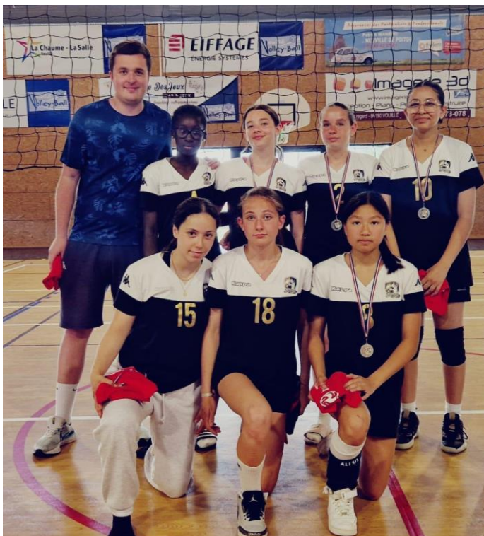
Finaliste Féminin : Stade Poitevin