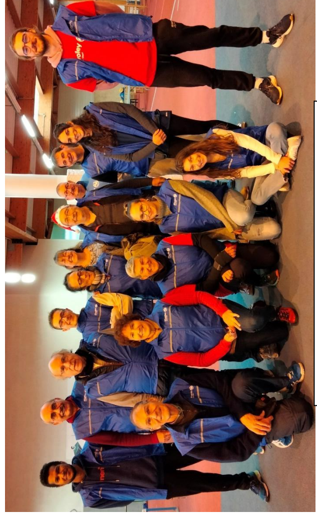
Une partie des acteurs de cette journée