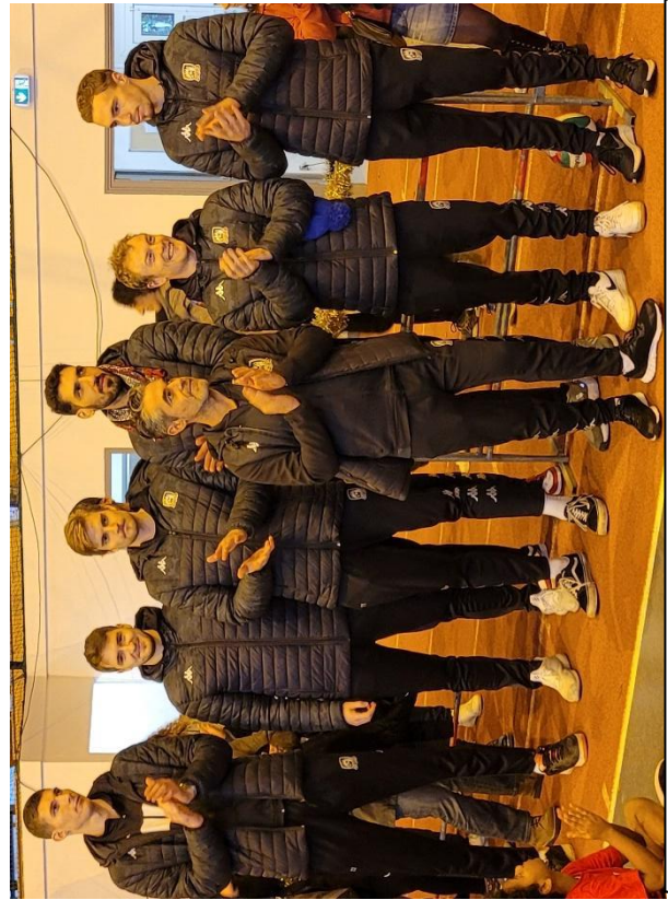
L'équipe Pro du Stade Poitevin venue remettre les récompenses aux enfants