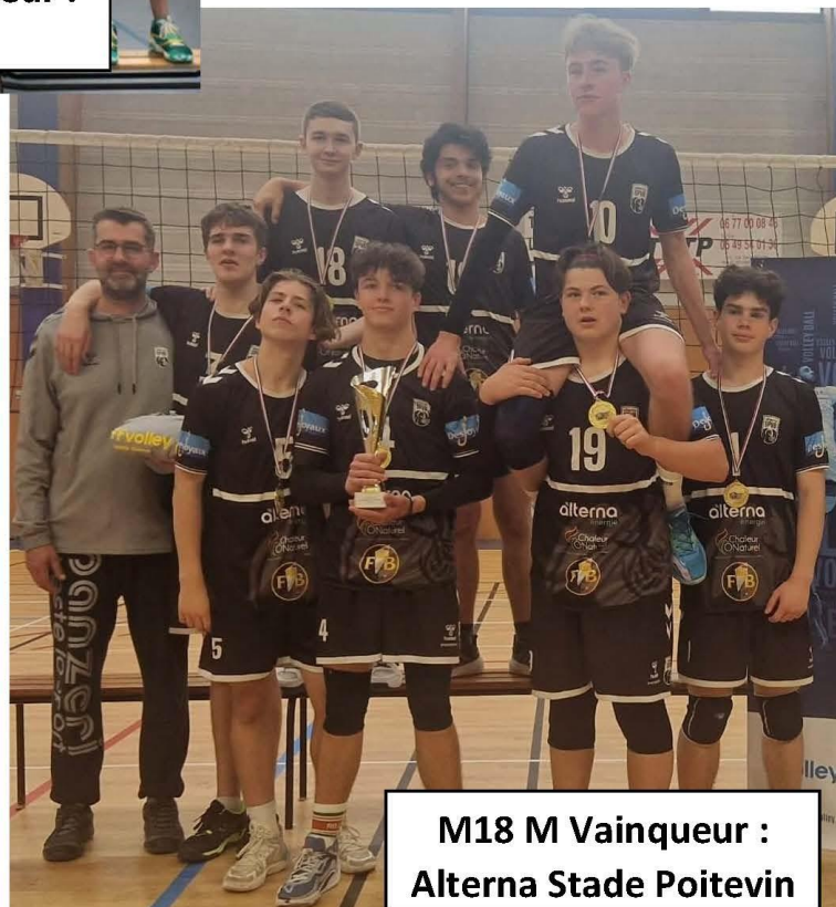
M18 M Vainqueur : Alterna Stade Poitevin