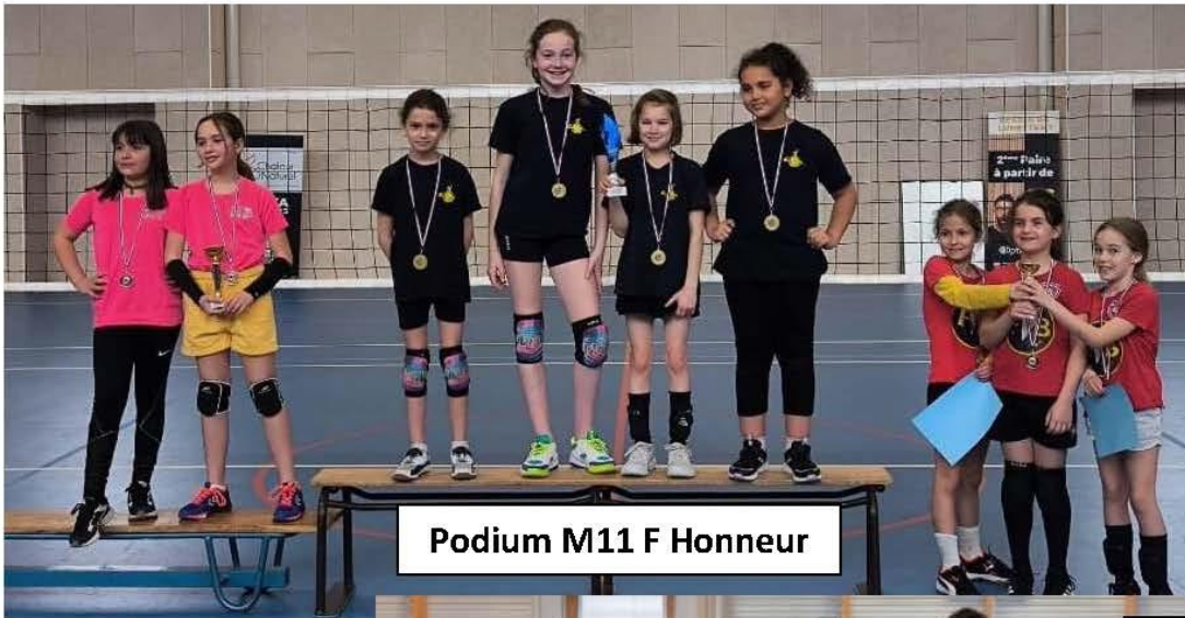
Podium M11 F Honneur