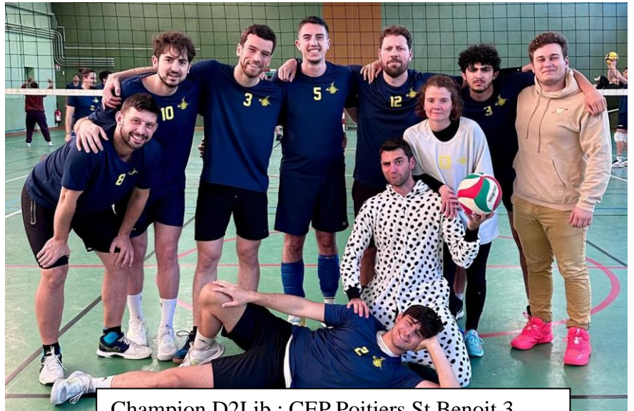
Champion D2Lib : CEP Poitiers St Benoît 3