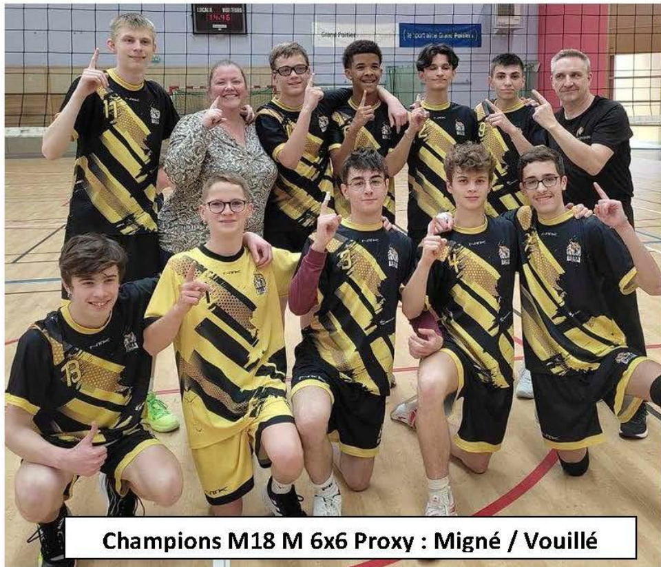
Champions M18 M 6x6 Proxy : Migné / Vouillé