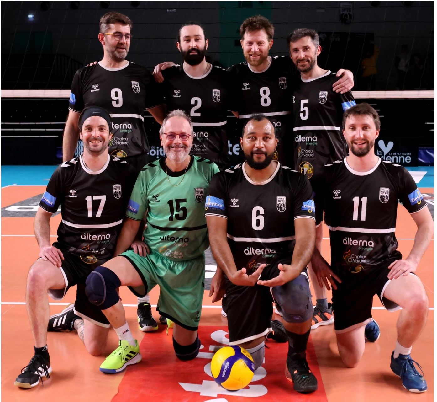
ALTERNA STADE POITEVIN 5