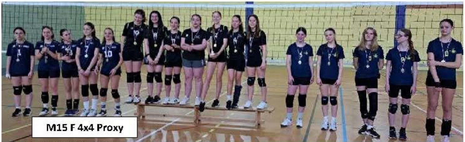
M15 F 4x4 Proxy