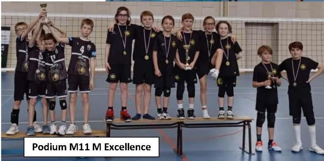
Podium M11 M Excellence