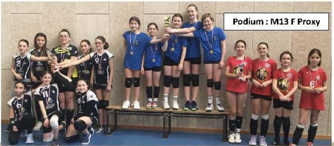
Podium : M13 F Proxy