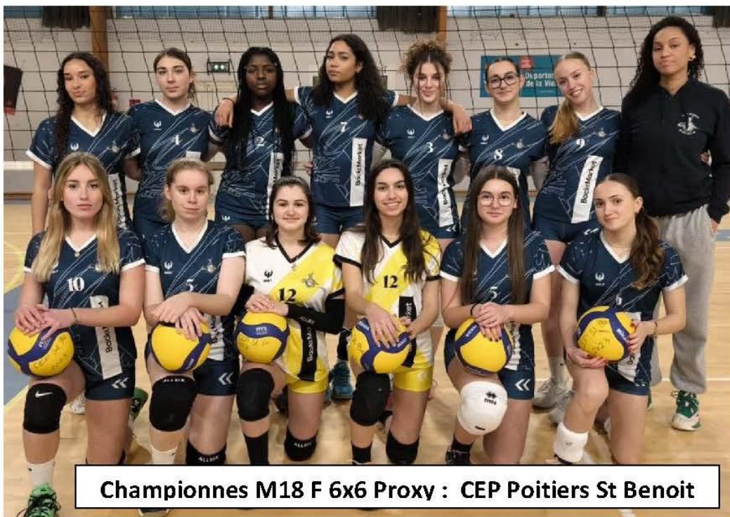
Championnes M18 F 6x6 Proxy : CEP Poitiers St Benoit