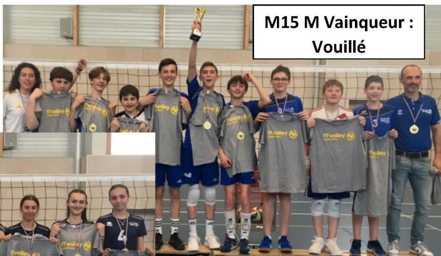
M15 M Vainqueur : Vouillé