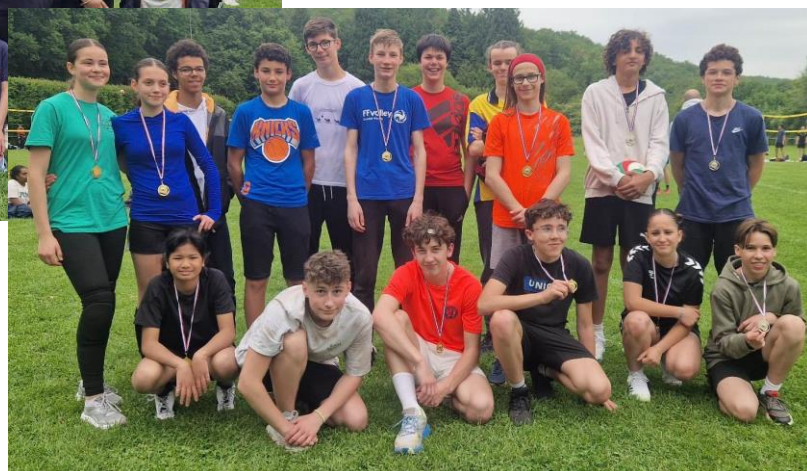
Etape de Béruges : 22 équipes