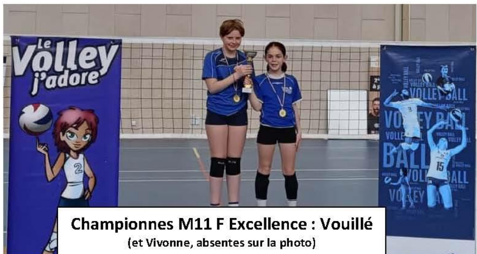
Championnes M11 F Excellence : Vouillé (et Vivonne, absentes sur la photo)