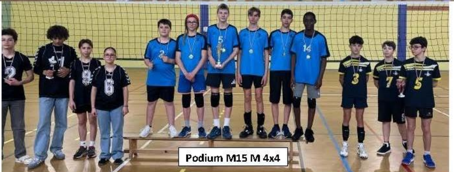
Podium M15 M 4x4