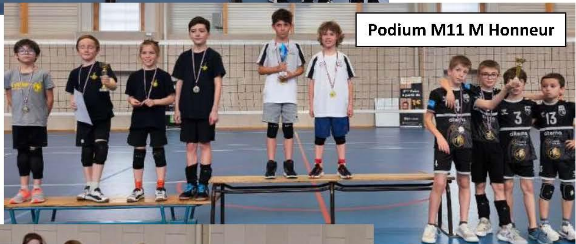
Podium M11 M Honneur