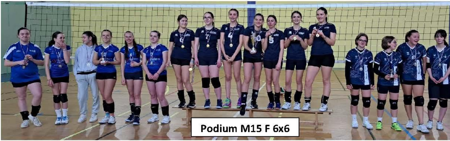
Podium M15 F 6x6