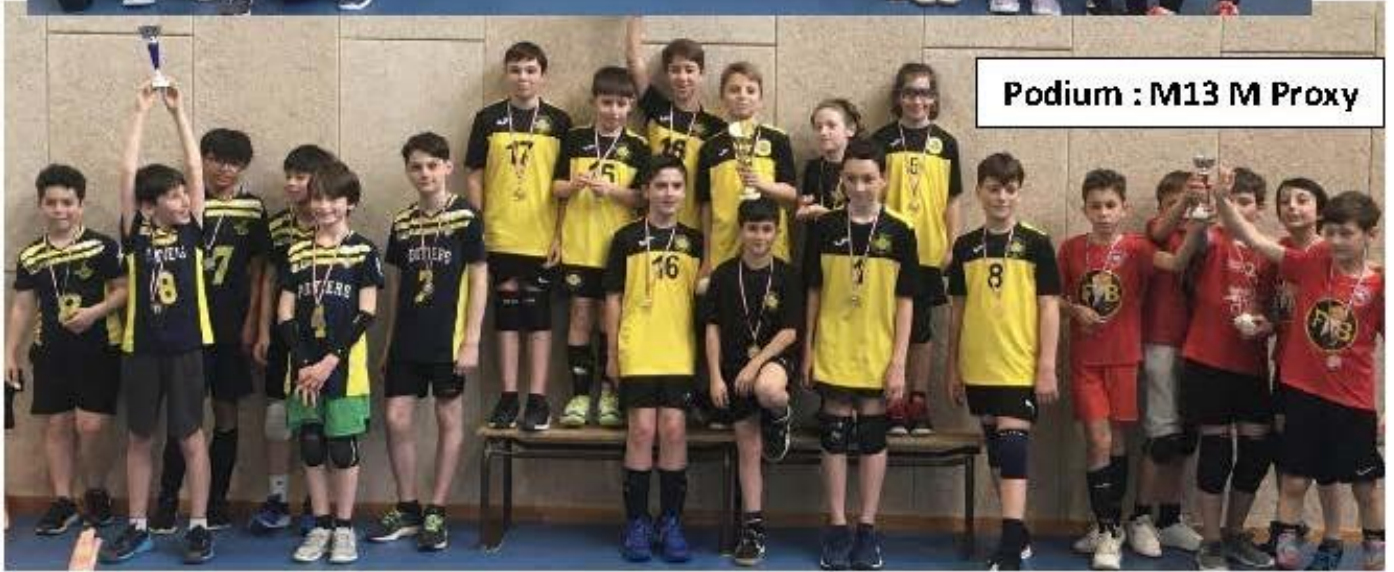
Podium : M13 M Proxy